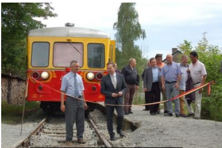
Le gouverneur de Namur inaugure le tronçon Purnode – Bauche le 12 juin 2015