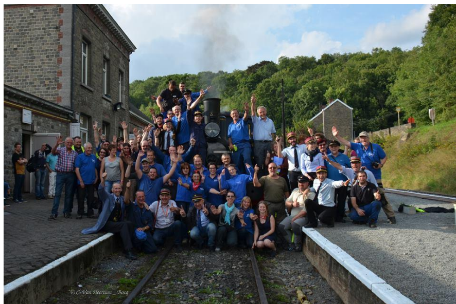
L'équipe du CFB lors du Festival 2017