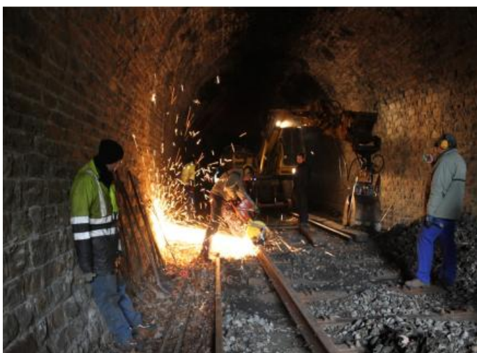
Travaux de réhabilitation du tunnel de Spontin