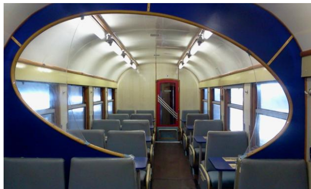
La voiture restaurant

Prix par personne : 79,50 € : trajet commenté en train, apéritif avec accompagnements, menu 3 services (entrée, plat et dessert), vin blanc et/ou rouge, eau plate et pétillante, café à volonté (softs et bières en supplément).