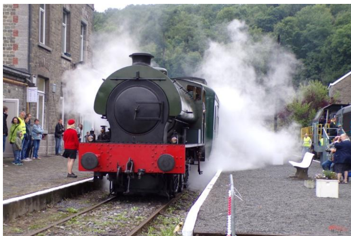
0-3-0T, locomotive type 'Austerity' du War Department anglais, de 1943, provenant du "Stoom Centrum Maldegem" (ligne Eeklo-Maldegem).

La qualité du spectacle n'est plus à prouver : chaque année, passionnés ou simples visiteurs d'un jour viennent des quatre coins de la Belgique et de l'étranger. Ils se donnent rendez-vous à Spontin pour assister aux nombreuses manœuvres et échanges de locomotives dans un cadre convivial et chaleureux.