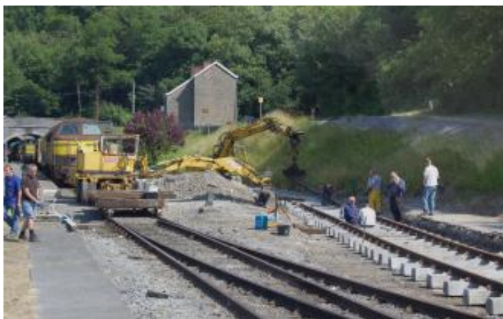
Les bénévoles, dans une ambiance fraternelle, œuvrent à la pose d'une seconde voie en gare de Spontin

La ligne du Bocq présente, tout au long de ses 21 kilomètres, une diversité de paysages impressionnante. A Ciney, la ligne se situe sur le plateau du Condroz, caractérisé par ses nombreux champs, tandis qu'Yvoir se trouve dans la vallée de la Meuse. A hauteur de la gare de Braibant, la ligne s'enfonce dans la vallée où elle s'unit littéralement à la nature pour ne plus faire qu'un. Le paysage défile et change sans arrêt, tandis que les franchissements du Bocq et de tunnels se succèdent de manière inattendue. Les voyageurs peuvent profiter de la beauté des lieux grâce à nos autorails panoramiques ou, en juillet et août particulièrement, à l'intérieur de nos rames tractées historiques.